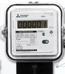
มิเตอร์อิเล็กทรอนิกส์