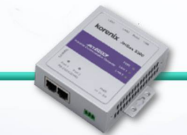
กล่องเอดีซี (ADC)