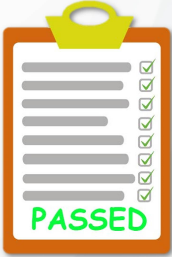
ตัวอย่างผลการทดสอบจากการไฟฟ้า

ทุกเครื่องมี ID code ให้ใช้ผลการทดสอบได้